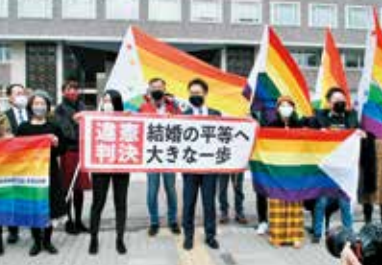
札幌地裁が、同性婚を認めないのは憲法14条が保障する「法の下の平等」に反し、違憲と判断！ (2021年3月17日 札幌市)